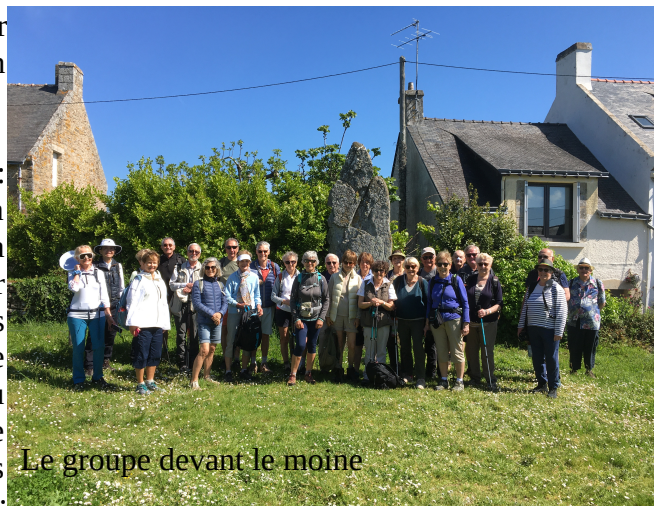
Le groupe devant le moine