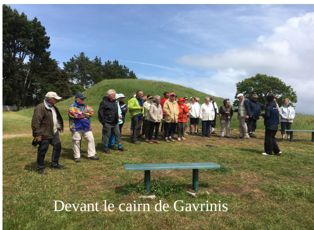
Devant le cairn de Gavrinis

Par petits groupes nous sommes entrés dans ce cairn pour admirer les parois gravées.